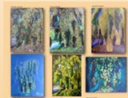
Dessins aux crayons Prismacolor sous le thème de l'arbre