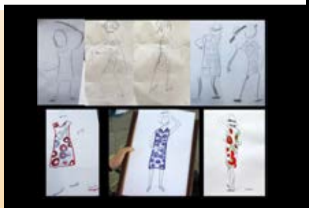
Rencontre du 13 juillet

CE FUT DES MOMENTS TRÈS AGRÉABLES À SE REVOIR, QUE DU PLAISIR ET DE BELLES RENCONTRES. NOUS POURSUIVONS TOUJOURS EN ZOOM ET EN PRÉSENCE ET GARDONS LE CONTACT ENTRE NOUS, SI PRÉCIEUX!