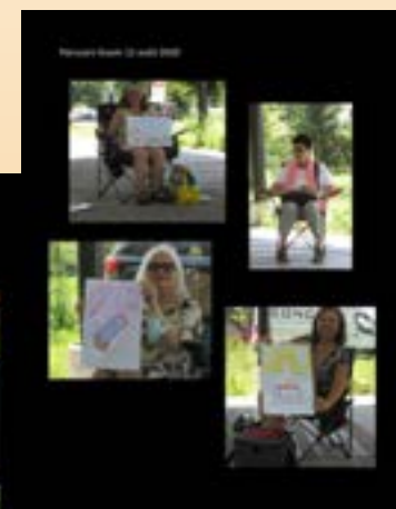
Rencontre du 12 août